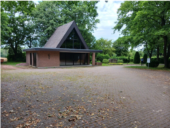
Bedburg, Umsiedlung Königshoven, Friedhof, Blick vom Eingang Kirchplatz Richtung Nordosten, 15.7.2023