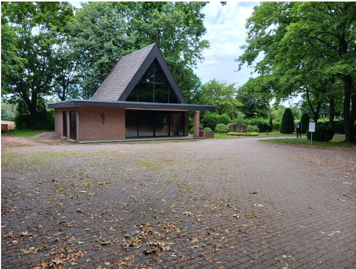
Bedburg, Umsiedlung Königshoven, Friedhof, Blick vom Eingang Kirchplatz Richtung Nordosten, 15.7.2023