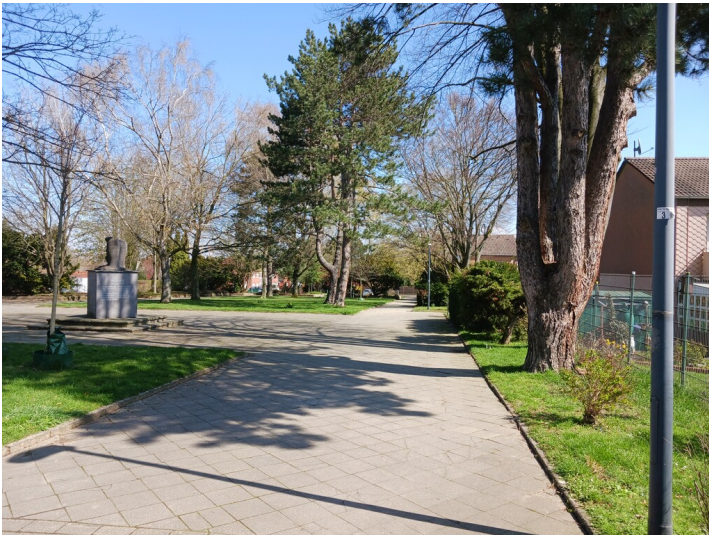
Kinzweiler, Von-Trips-Platz in der Umsiedlung Langweiler, 5.4.2023