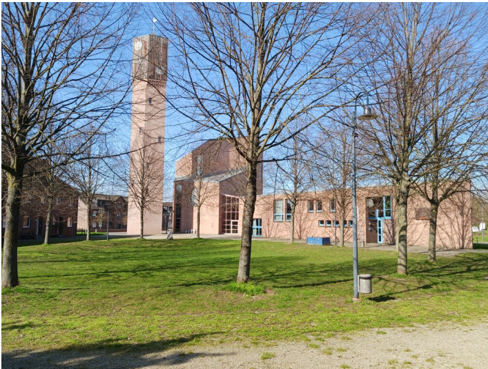
Inden/Altdorf, Kath. Pfarrkirche St. Clemens und St. Pankratius, Blick von Süden, 5.4.2023