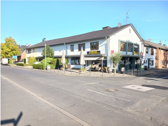
Umsiedlung Berrenrath, Kino Berli, Blick von Süden, 22.9.2022