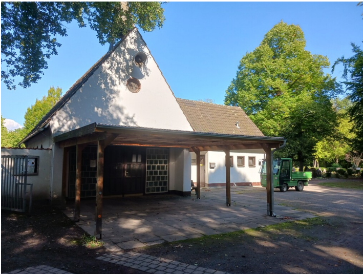
Berrenrath, Friedhofskapelle mit offener Vorhalle, Blick von Osten, rechts Wirtschaftsflügel, 21.9.2022