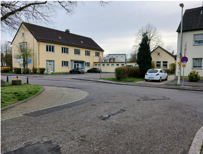
Frechen-Grefrath, Schule, Blick von Norden, 28.3.2023