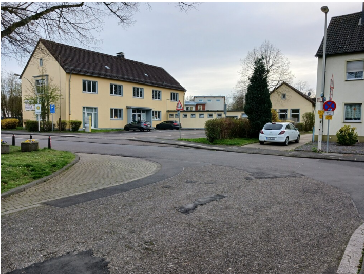
Frechen-Grefrath, Schule, Blick von Norden, 28.3.2023