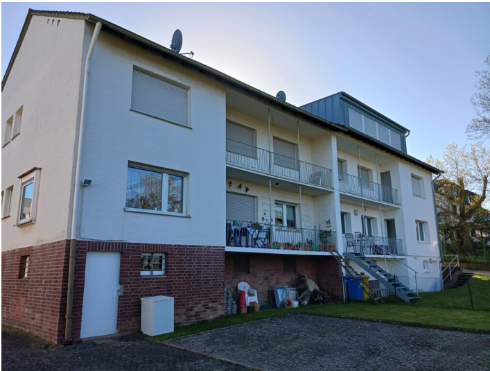
Zülpich, Siedlung Geicher Gasse, Mehrfamilienhaus, Gartenseite (Norden), 14.4.2023