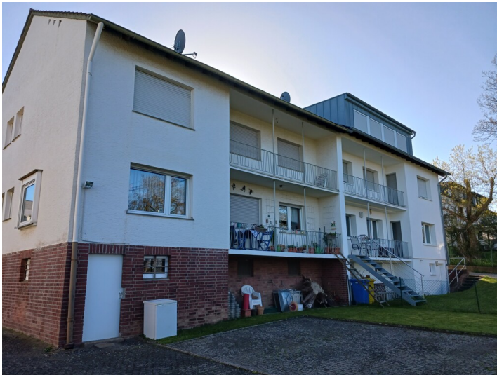
Zülpich, Siedlung Geicher Gasse, Mehrfamilienhaus, Gartenseite (Norden), 14.4.2023