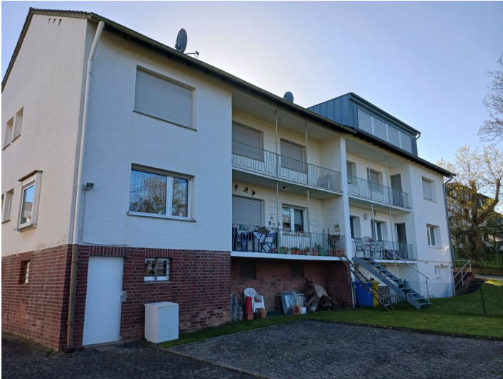
Zülpich, Siedlung Geicher Gasse, Mehrfamilienhaus, Gartenseite (Norden), 14.4.2023