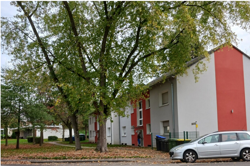
Lucherberg, Siedlung An der Kippe, Typ 7: Mehrfamilienhaus, 5.11.2022