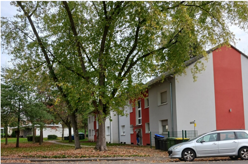
Lucherberg, Siedlung An der Kippe, Typ 7: Mehrfamilienhaus, 5.11.2022