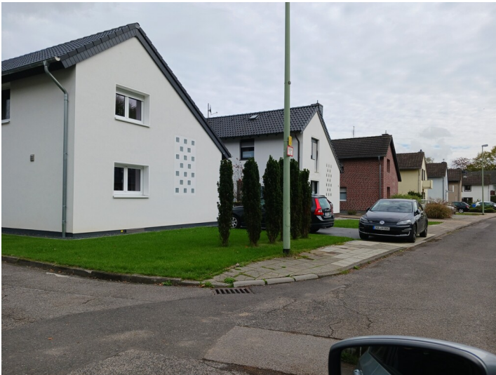
Inden-Lucherberg, Siedlung An der Kippe, Haustyp 3, Talstraße, Blick von Westen, 5.11.2022