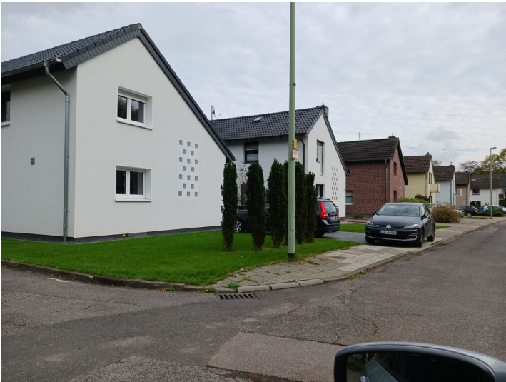
Inden-Lucherberg, Siedlung An der Kippe, Haustyp 3, Talstraße, Blick von Westen, 5.11.2022