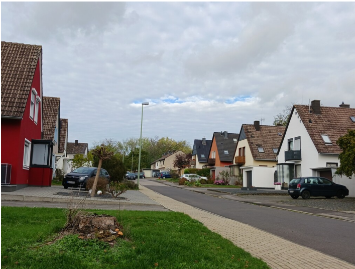
Lucherberg, An der Kippe, Haustyp 1, 5.11.2022