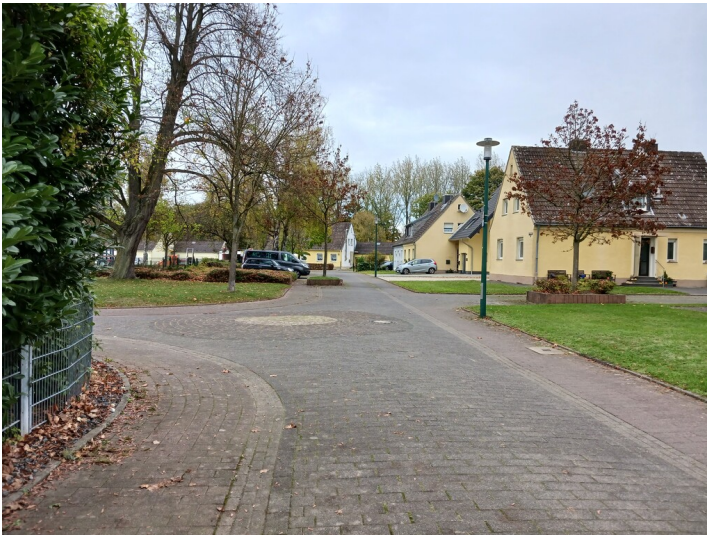
Werkssiedlung Berrenrath, Erftstraße, Platz an Biegung im Nordosten, Blick von Süden, 3.11.2022