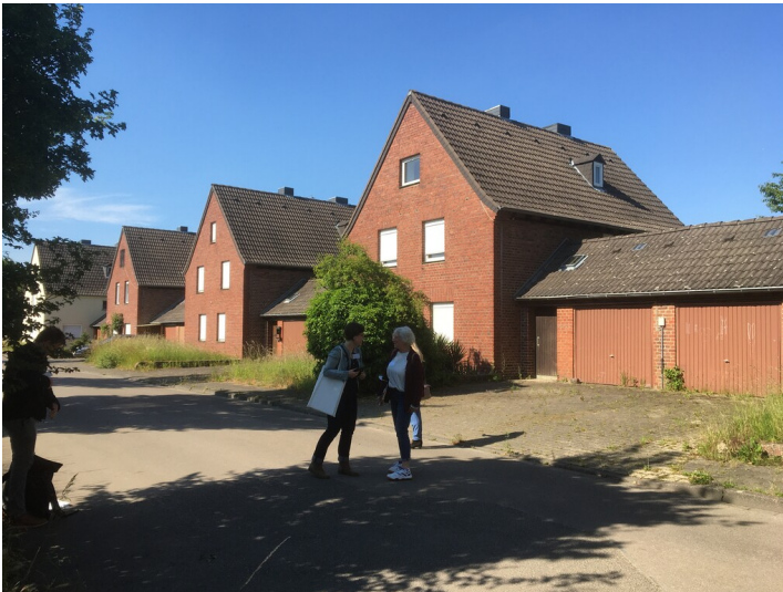
Morschenich, Werkssiedlung Bergwerk Union 103, Unterstraße, Blick von Süden, 2.6.2022