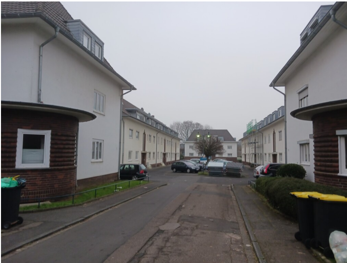
Hürth, Werksiedlung Clementinenhof, Blick von Westen in den Hof, 25.1.2023