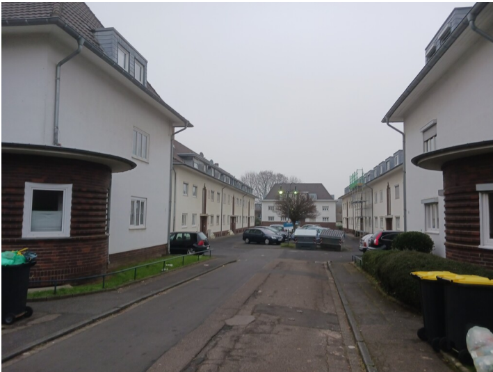
Hürth, Werksiedlung Clementinenhof, Blick von Westen in den Hof, 25.1.2023