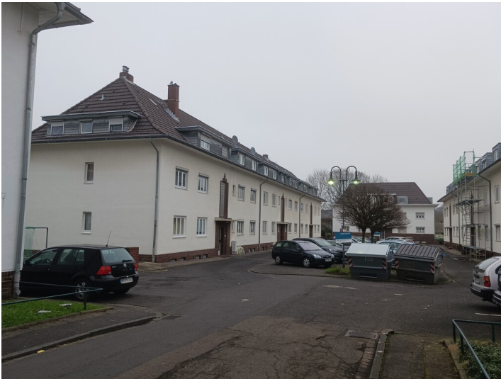
Hürth_Clementinenhof, Innenhof, Blick nach Nordosten, 25.1.2023