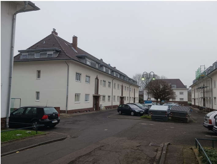
Hürth_Clementinenhof, Innenhof, Blick nach Nordosten, 25.1.2023