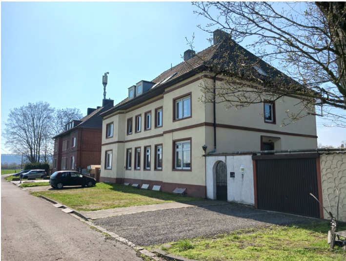
Eschweiler, Wohnhäuser Langgasse, Blick von Norden, 5.4.2023