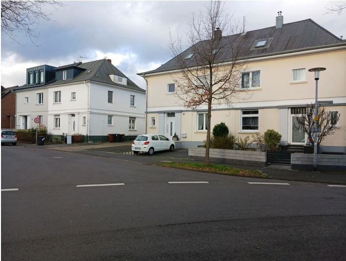
Hürth, Doppelhaushälften Marienbornweg, Blick von Süden, 3.1.2023