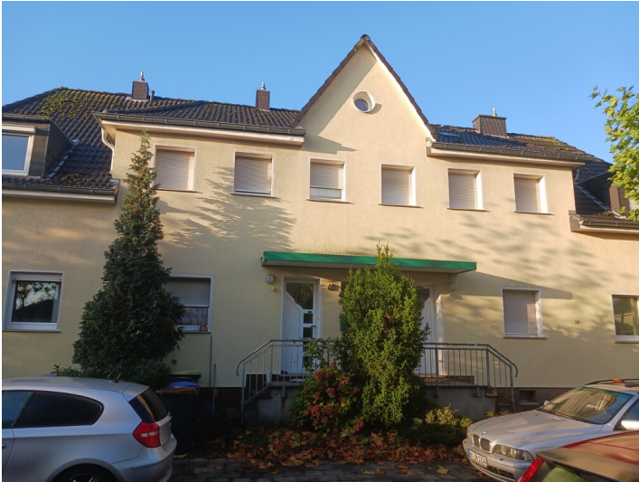
Oberaußem, Siedlung Kraftwerk, Mittelhaus, Abts-Acker-Straße, 5.11.2022