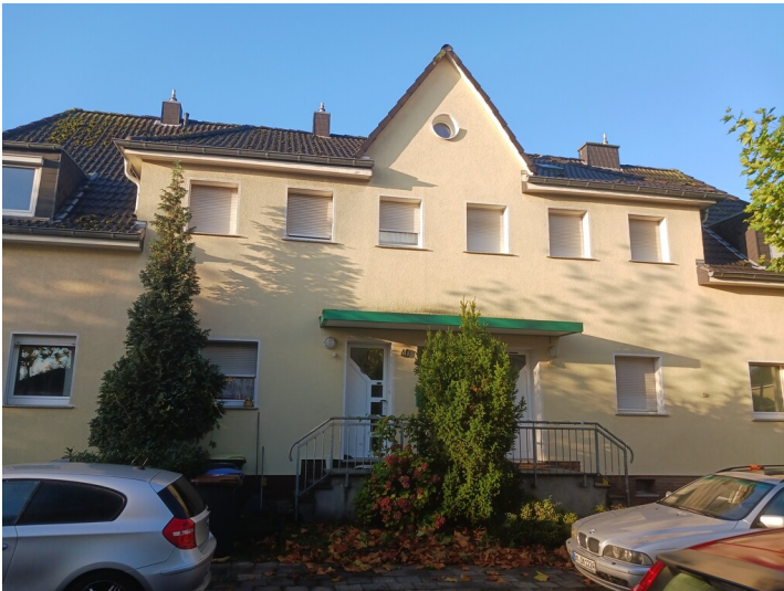
Oberaußem, Siedlung Kraftwerk, Mittelhaus, Abts-Acker-Straße, 5.11.2022