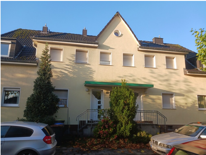
Oberaußem, Siedlung Kraftwerk, Mittelhaus, Abts-Acker-Straße, 5.11.2022