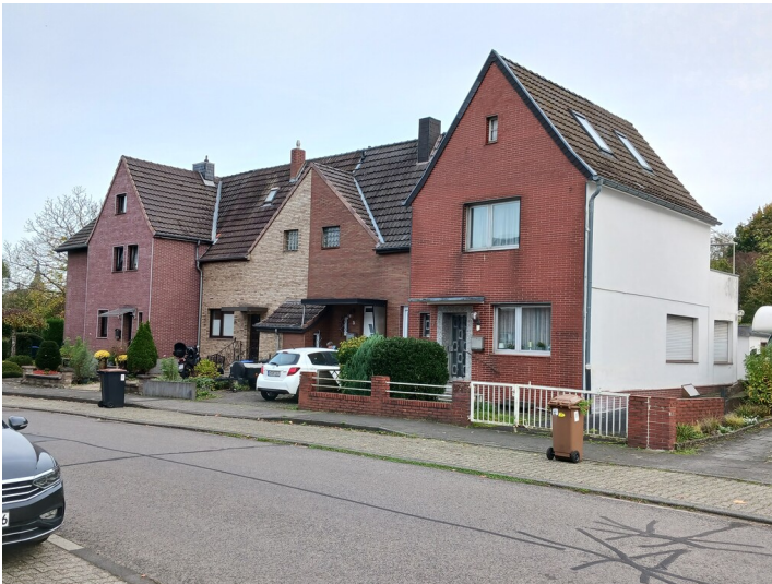
Brühl-Heide, Werksiedlung Gruhl I, Haustyp 3 (mittlere Häuser), 31.10.2022