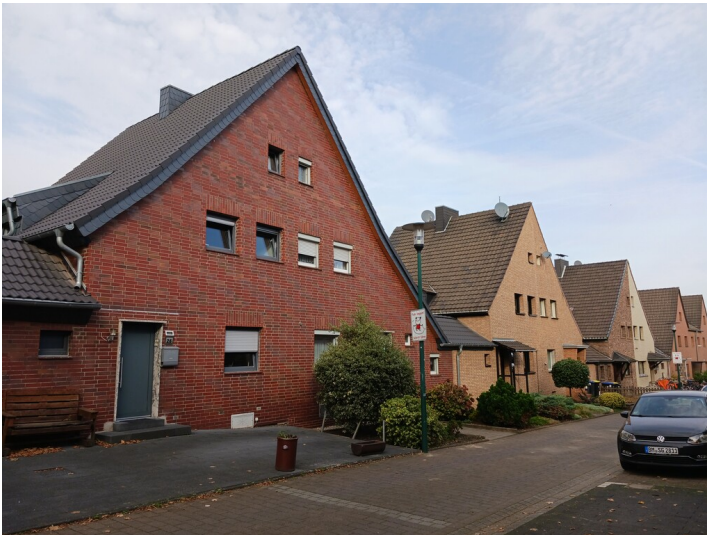
WBG-Siedlung Gleuel, Haustyp D als giebelständiges Doppelhaus, Beispiel: Barbarastraße 26/24, 22/20, 18/16