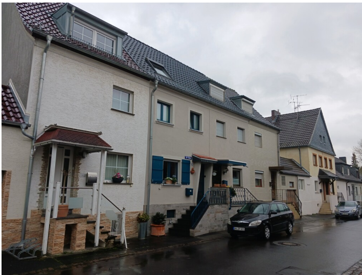
Brühl, WBG-Siedlung Gabjei, Haustyp D als zweigeschossiges Reihnhaus, 20.4.2023