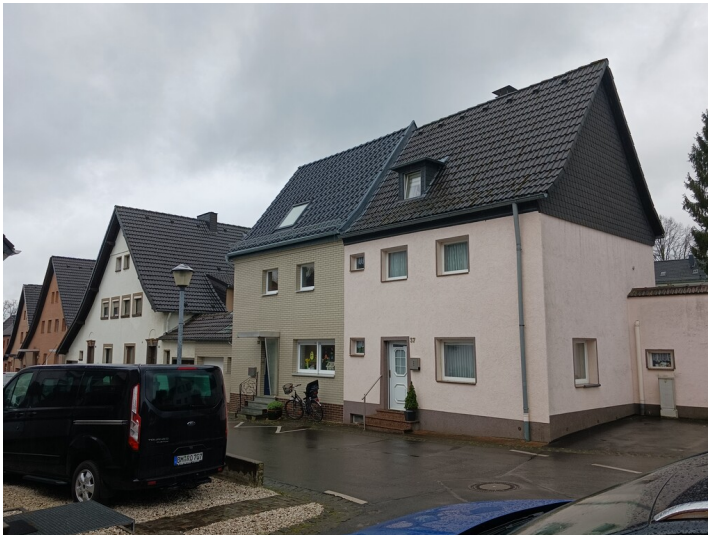
Brühl, WBG-Siedlung Gabjei, Beispiel Haustyp C als traufständiges, zweistöckiges Doppelhaus, 20.4.2023