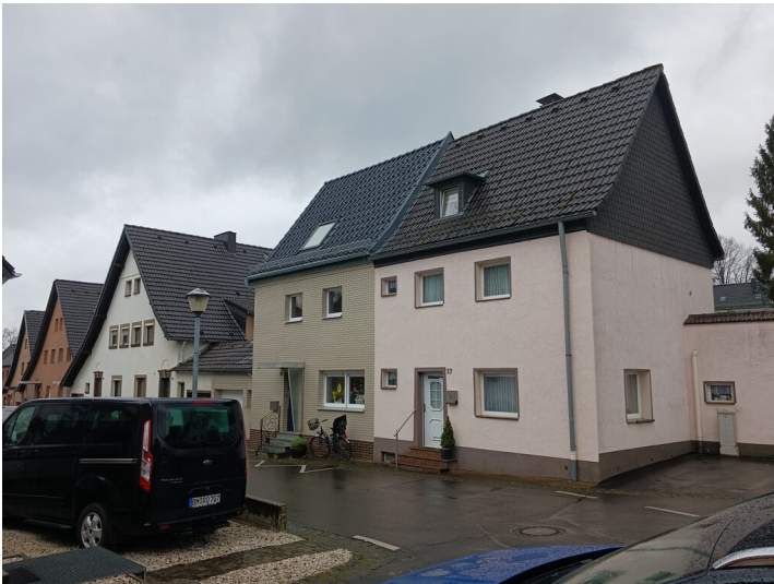
Brühl, WBG-Siedlung Gabjei, Beispiel Haustyp C als traufständiges, zweistöckiges Doppelhaus, 20.4.2023