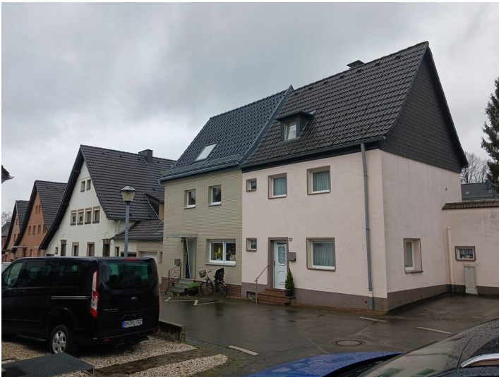
Brühl, WBG-Siedlung Gabjei, Beispiel Haustyp C als traufständiges, zweistöckiges Doppelhaus, 20.4.2023