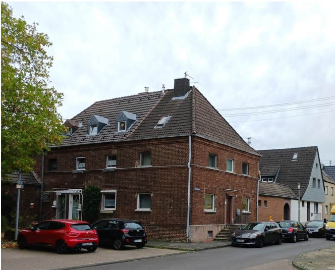
Köttingen, ehem. Konsum II, Mittelstraße 1, Blick von Nordwesten, 3.11.2022