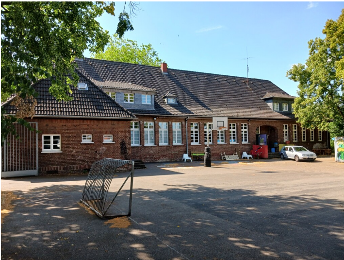
Erfstadt, Siedlung Köttingen, ehem. Schule, Hofseite, Blick von Norden, 11.7.2023