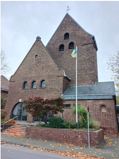
Köttingen, St. Joseph, Blick von Norden, 3.11.2022