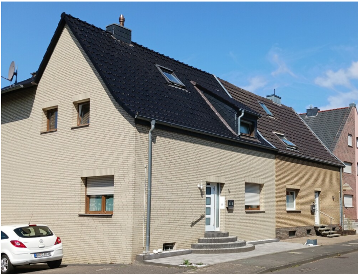
Köttingen, Hermann-Köster-Straße 14-16, Blick von Osten, 11.7.2023