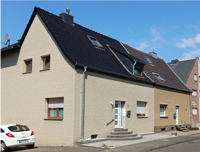
Köttingen, Hermann-Köster-Straße 14-16, Blick von Osten, 11.7.2023