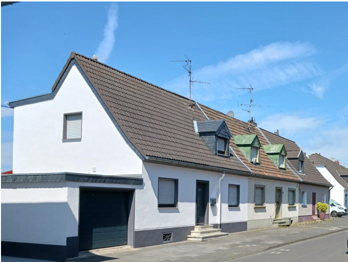
Köttingen, Haustyp A, Mittelstraße 22-26, 11.7.2023