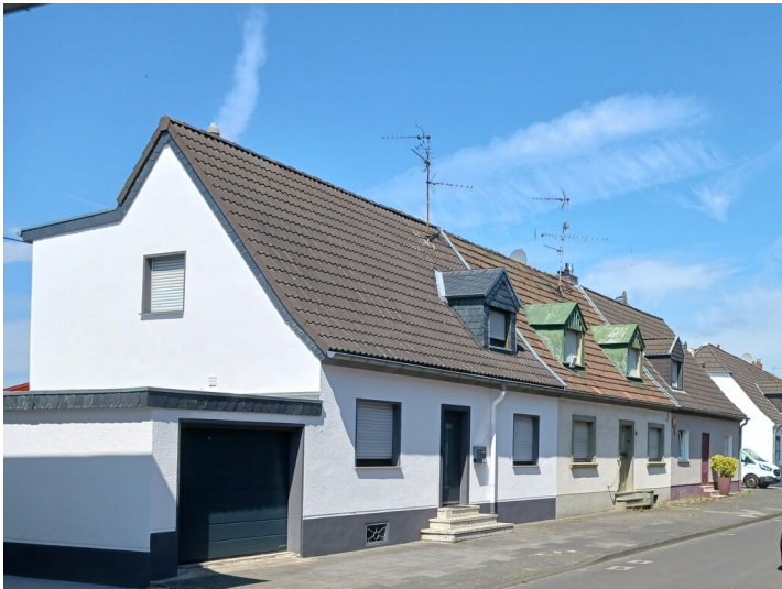
Köttingen, Haustyp A, Mittelstraße 22-26, 11.7.2023