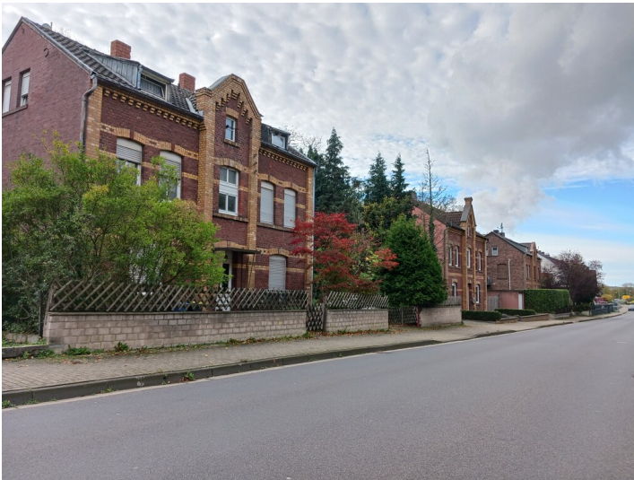
Inden-Lucherberg, Doppelwohnhäuser der Grube und Brikettfabrik, 5.11.2022