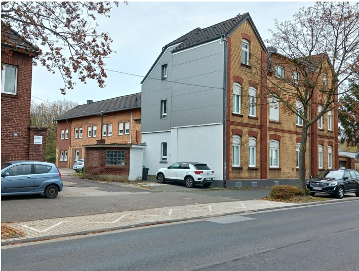
Kerpen-Brüggen, Beamtenwohnhaus Fabrik Hubertus, Heerstraße 363-365, Blick von Westen, 3.11.2022