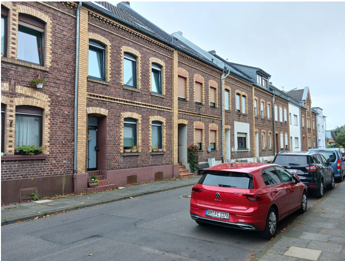
Liblar, Reihenhäuser Heidebroichstraße, Ostseite, Blick von Norden, 3.11.2022