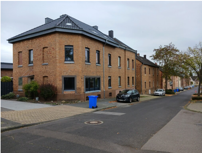
Liblar, Ehem. Konsum im Donatusdorf, Blick von Osten, 3.11.2022