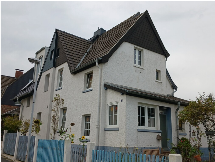
Brühl, Siedlung Kierberg/Gruhlwerk II, Doppelhaus Typ 1, 31.10.2022