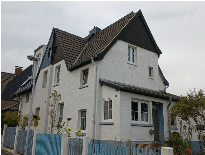
Brühl, Siedlung Kierberg/Gruhlwerk II, Doppelhaus Typ 1, 31.10.2022