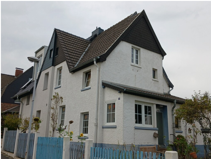
Brühl, Siedlung Kierberg/Gruhlwerk II, Doppelhaus Typ 1, 31.10.2022