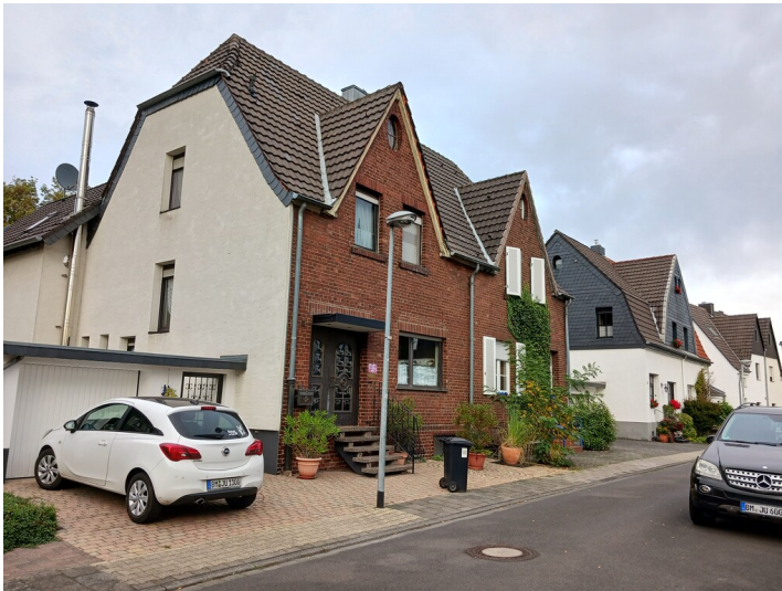
Werkssiedlung Kierberg/Gruhl II., Haustyp 1, Blick von Süden, 31.10.2022