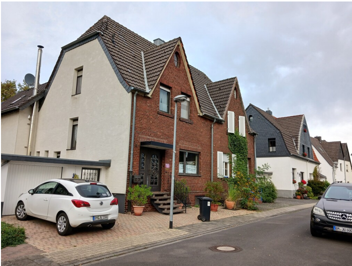
Werkssiedlung Kierberg/Gruhl II., Haustyp 1, Blick von Süden, 31.10.2022