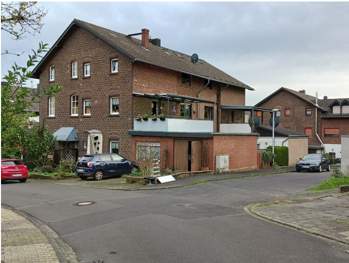
Brühl-Kierberg, Siedlung Gruhl II, Vierviertelhaus Vochemer Straße, Blick von Westen, 31.10.2022