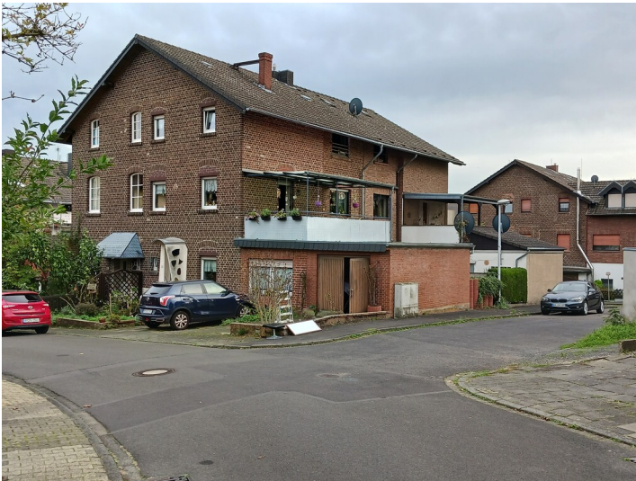
Brühl-Kierberg, Siedlung Gruhl II, Vierviertelhaus Vochemer Straße, Blick von Westen, 31.10.2022