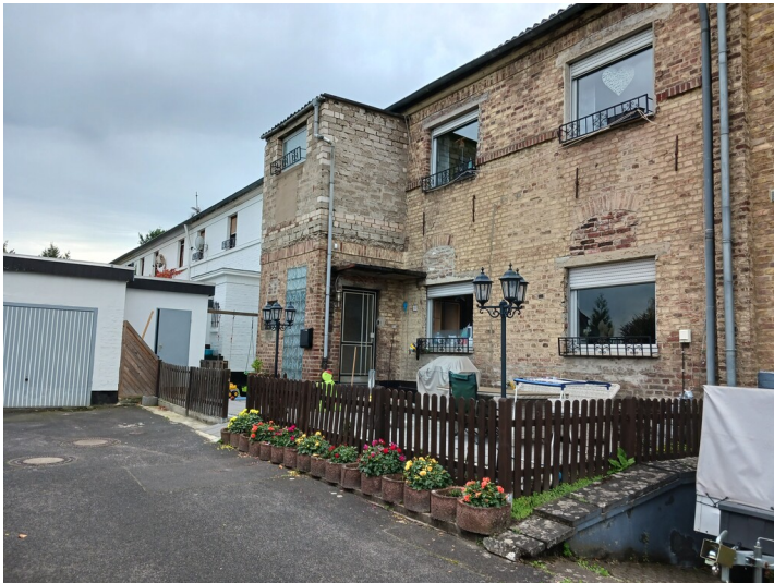
Brühl, Siedlung Vendel, Lohrbergstraße, Hausteile 1b-1i, 3.11.2022