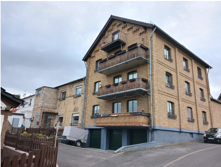
Brühl, Werkssiedlung Vendel, Kopfbau, Blick von Osten, 3.11.2022