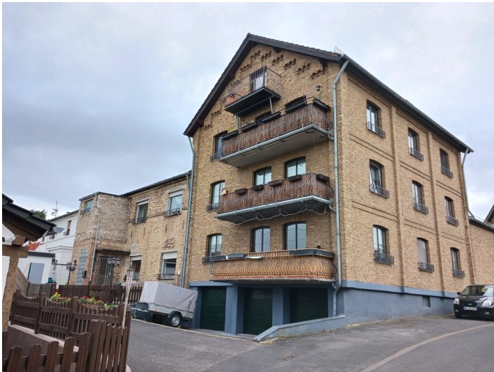
Brühl, Werkssiedlung Vendel, Kopfbau, Blick von Osten, 3.11.2022