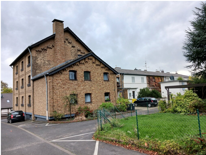
Brühl, Siedlung Vendel, Blick von Westen, 3.11.2022