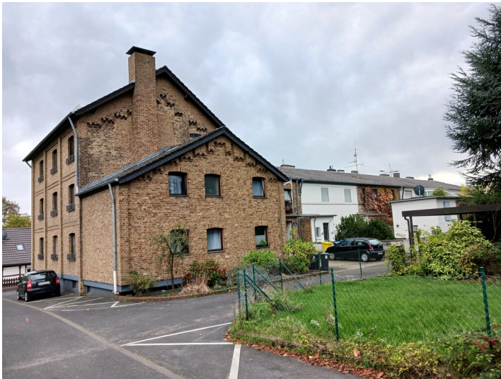
Brühl, Siedlung Vendel, Blick von Westen, 3.11.2022