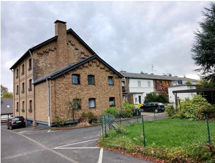
Brühl, Siedlung Vendel, Blick von Westen, 3.11.2022