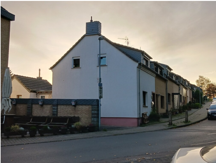
Brühl, Kolonie Pingsdorf, Reihenhauszeile, Blick von Osten, 31.10.2022