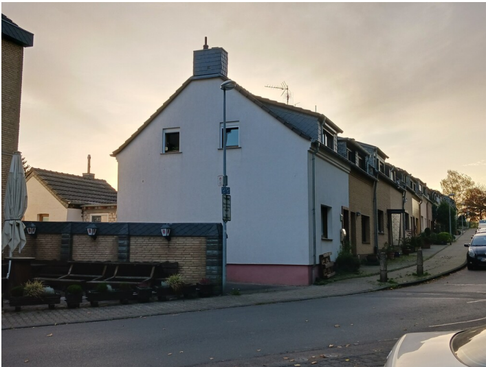
Brühl, Kolonie Pingsdorf, Reihenshauszeile, Blick von Osten, 31.10.2022