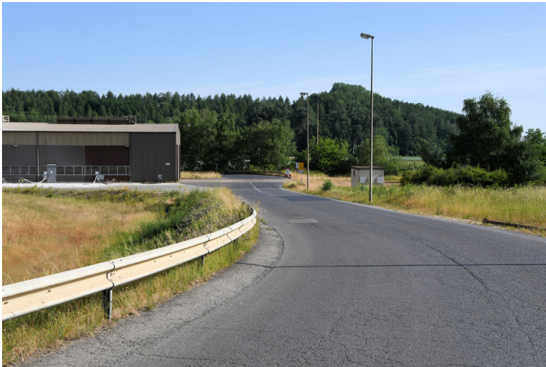
Kraftwerk Weisweiler: Am Kalkbahnhof, Ostabschnitt (im Hintergrund links der Kalkbahnhof), Ansicht von Süden