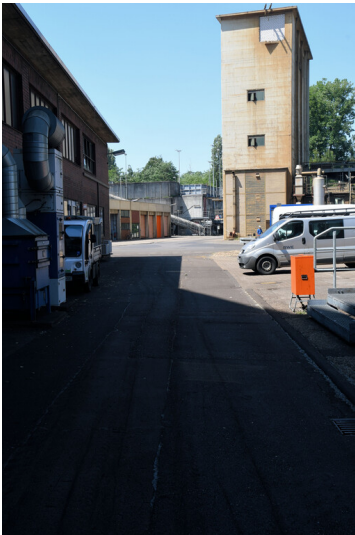
Kraftwerk Weisweiler: Feuerwehrstraße (im Hintergrund), Beginn an der Kreuzung mit der Garagenstraße vor dem Aschestaubunker, Ansicht von Osten; Foto: 13.06.2023