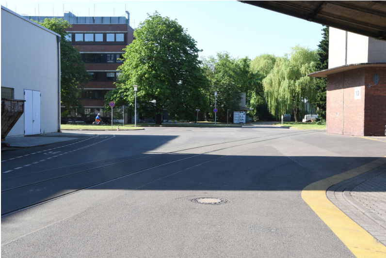
Kraftwerk Weisweiler: Garagenstraße, Abzweig von der Kantinenstraße, Ansicht von Norden; Foto: 13.06.2023