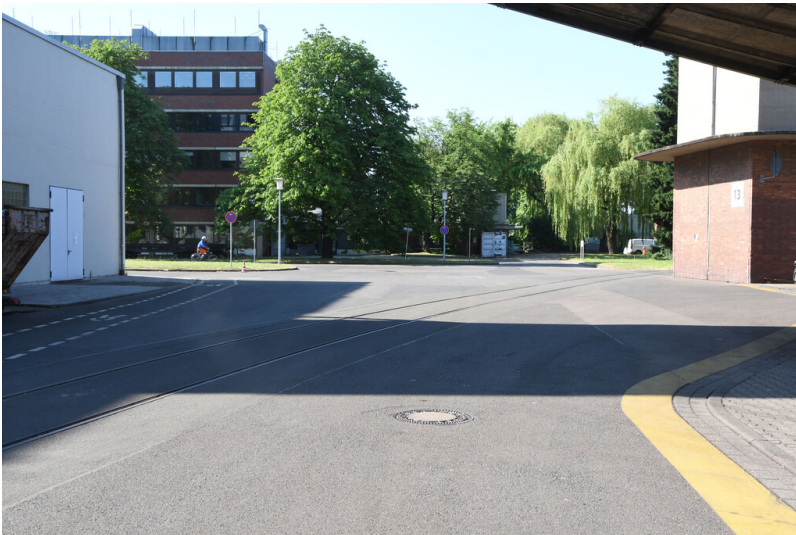
Kraftwerk Weisweiler: Garagenstraße, Abzweig von der Kantinenstraße, Ansicht von Norden; Foto: 13.06.2023