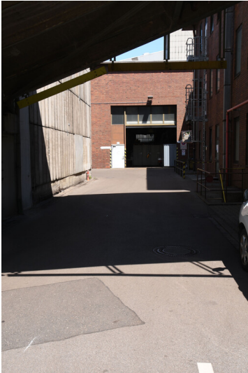
Kraftwerk Weisweiler: Lagerstraße, Abzweig von der Kantinenstraße, Ansicht von Süden