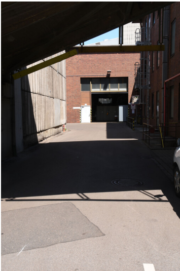
Kraftwerk Weisweiler: Lagerstraße, Abzweig von der Kantinenstraße, Ansicht von Süden; Foto: 13.06.2023