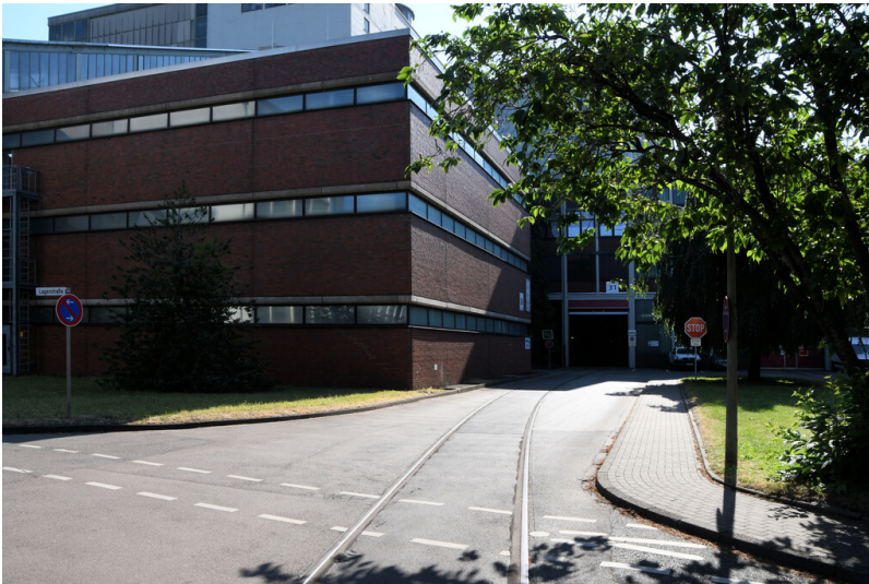
Kraftwerk Weisweiler: Kantinenstraße, mit Maschinenhausgleis, Ansicht von Westen; Foto: 13.06.2023