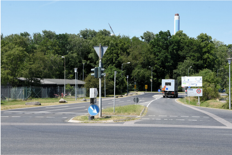
Kraftwerk Weisweiler: Kraftwerkszufahrt, Abzweig von der Straße "Am Kraftwerk", Ansicht von Süden; Foto: 13.06.2023