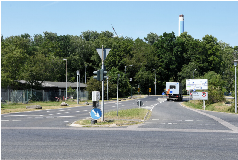
Kraftwerk Weisweiler: Kraftwerkszufahrt, Abzweig von der Straße "Am Kraftwerk", Ansicht von Süden; Foto: 13.06.2023