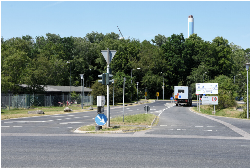
Kraftwerk Weisweiler: Kraftwerkszufahrt, Abzweig von der Straße "Am Kraftwerk", Ansicht von Süden; Foto: 13.06.2023