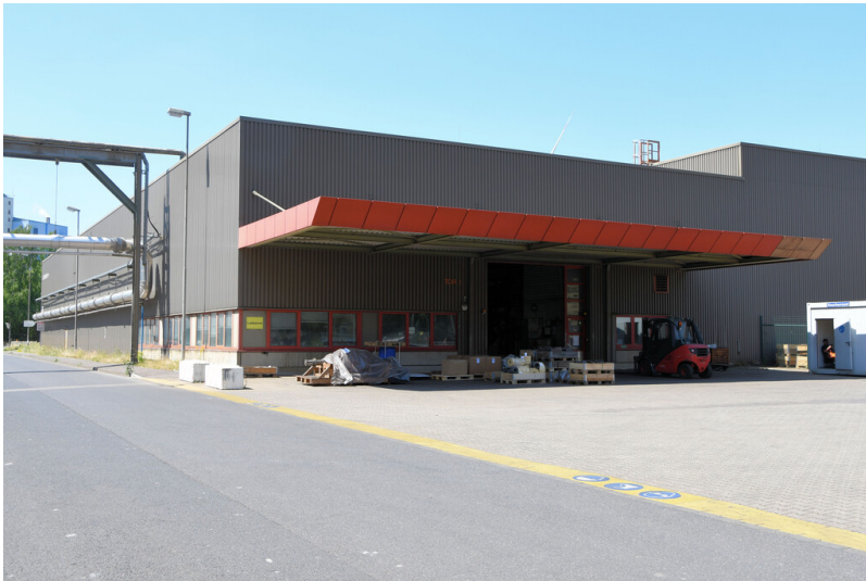
Kraftwerk Weisweiler: Lager 027, südlicher Hallenbau mit Warenannahme, Ansicht von Osten; Foto: 13.06.2023