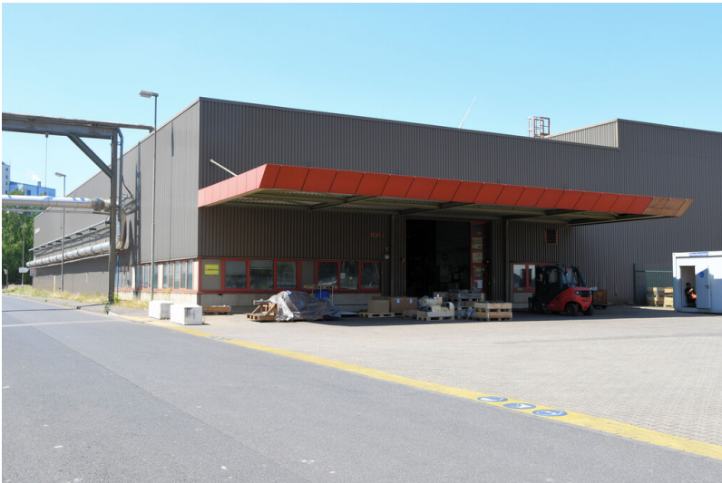
Kraftwerk Weisweiler: Lager 027, südlicher Hallenbau mit Warenannahme, Ansicht von Osten; Foto: 13.06.2023