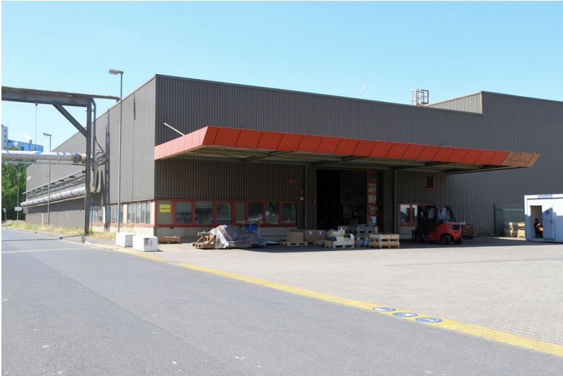
Kraftwerk Weisweiler: Lager 027, südlicher Hallenbau mit Warenannahme, Ansicht von Osten; Foto: 13.06.2023