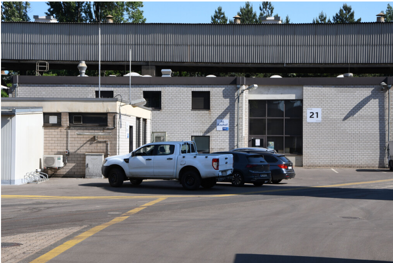
Kraftwerk Weisweiler: Bauhof, Ansicht von Süden; Foto: 13.06.2023