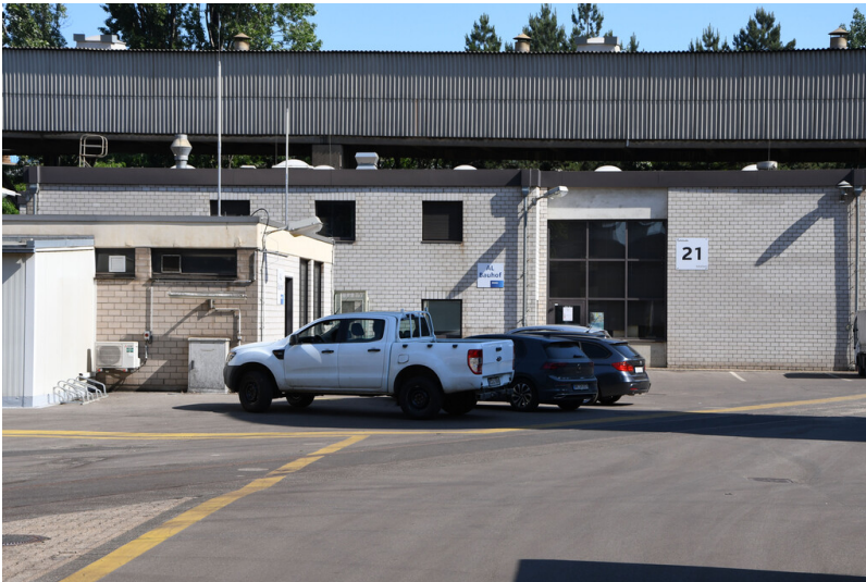
Kraftwerk Weisweiler: Bauhof, Ansicht von Süden; Foto: 13.06.2023