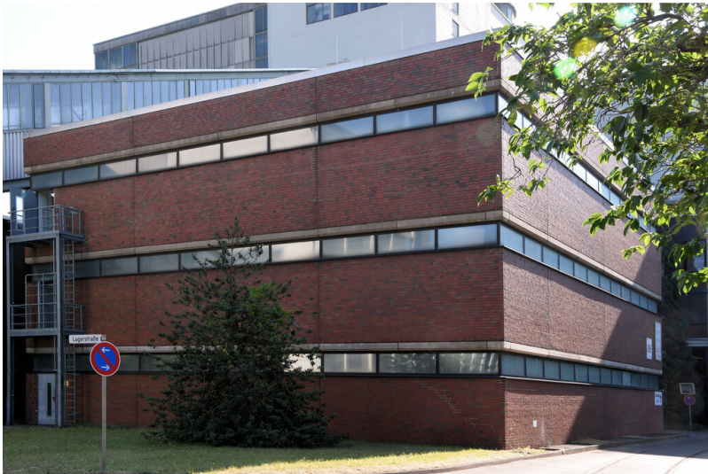
Kraftwerk Weisweiler: Sozialgebäude 2, Ansicht von Südwesten; Foto: 13.06.2023