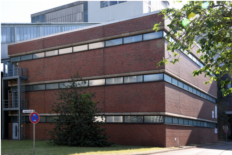
Kraftwerk Weisweiler: Sozialgebäude 2, Ansicht von Südwesten