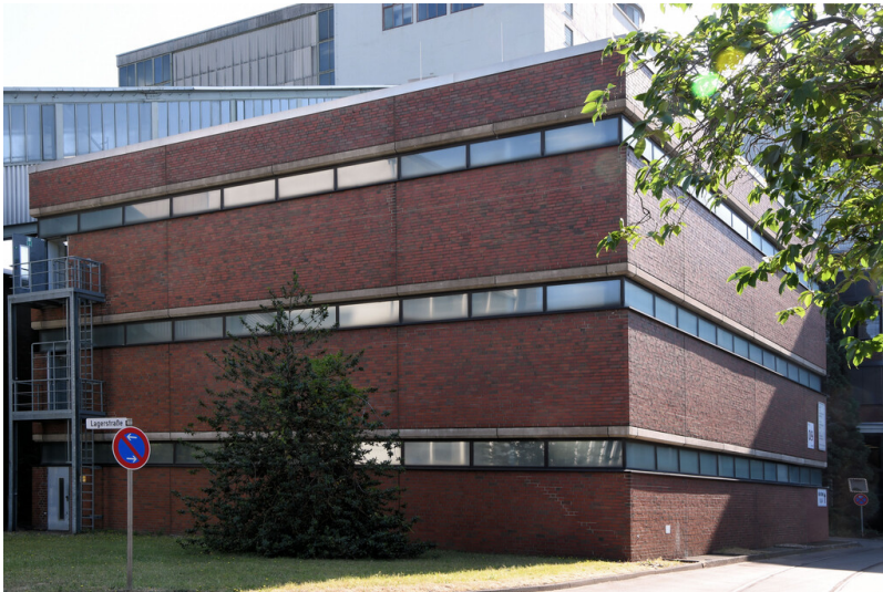
Kraftwerk Weisweiler: Sozialgebäude 2, Ansicht von Südwesten; Foto: 13.06.2023