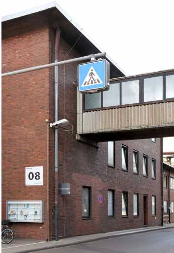
Kraftwerk Weisweiler: Sozialgebäude 1 (ehemals Waschkaue), Fußgängerbrücke zum Kesselhaus Block A, Ansicht von Süden; Foto: 16.06.2023