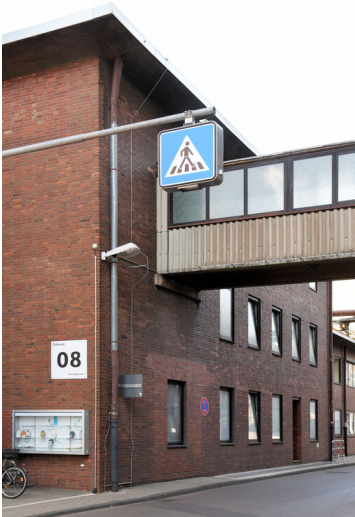
Kraftwerk Weisweiler: Sozialgebäude 1 (ehemals Waschkaue), Fußgängerbrücke zum Kesselhaus Block A, Ansicht von Süden; Foto: 16.06.2023