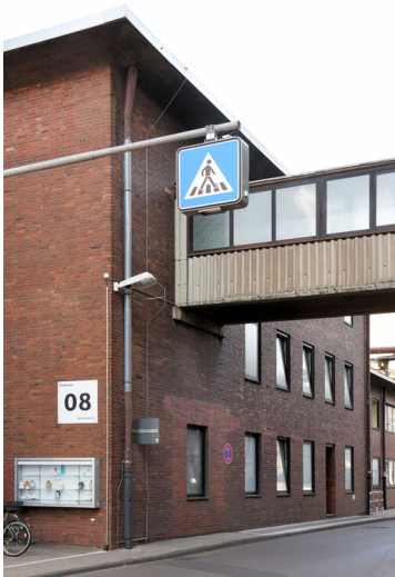
Kraftwerk Weisweiler: Sozialgebäude 1 (ehemals Waschkaue), Fußgängerbrücke zum Kesselhaus Block A, Ansicht von Süden; Foto: 16.06.2023