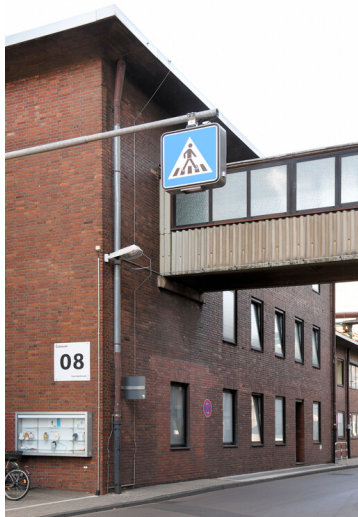
Kraftwerk Weisweiler: Sozialgebäude 1 (ehemals Waschkaue), Fußgängerbrücke zum Kesselhaus Block A, Ansicht von Süden; Foto: 16.06.2023