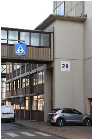
Kraftwerk Weisweiler: Auftragsleitstelle, Ansicht von Südwesten