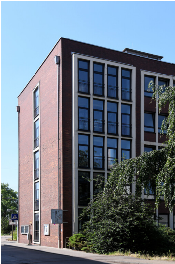
Kraftwerk Weisweiler: Verwaltung (älterer Gebäudetrakt), Treppenhaustrakt, Ansicht von Nordosten; Foto: 16.06.2023