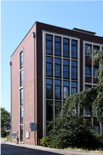
Kraftwerk Weisweiler: Verwaltung (älterer Gebäudetrakt), Treppenhaustrakt, Ansicht von Nordosten; Foto: 16.06.2023